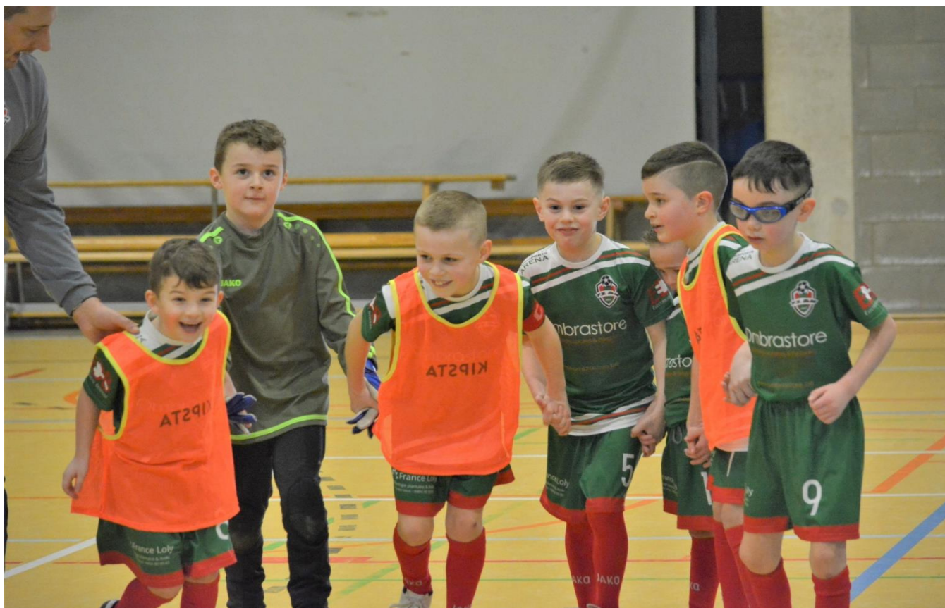
Les jeunes de FUTSAL OLNE