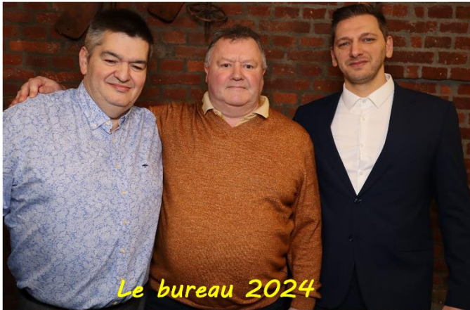
Le bureau 2024