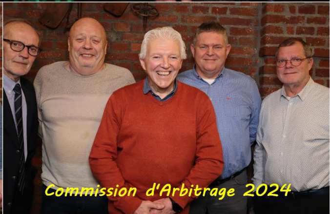
Commission d'Arbitrage 2024