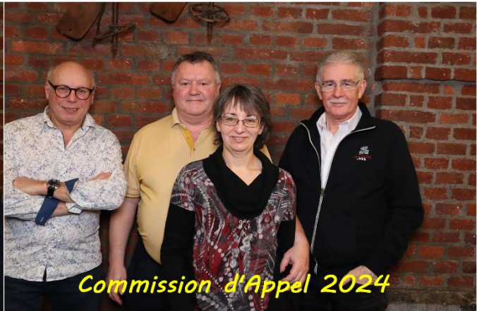
Commission d'Appel 2024